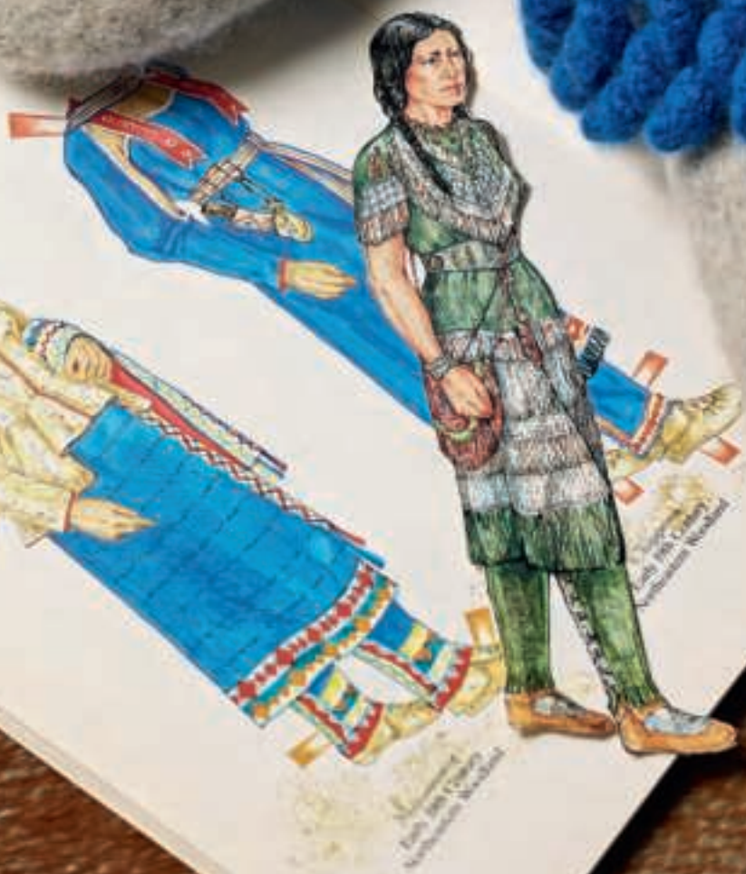
Early 19th Century Northwestern Washington