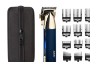
E992E 20 € CASHBACK*