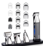
MT996E 20 € CASHBACK*