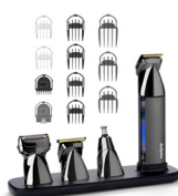
MT991E 20 € CASHBACK*