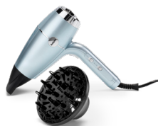
D773DE 10 € CASHBACK*