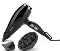
6716DE 10 € CASHBACK*