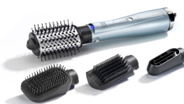
AS774E 10 € CASHBACK*