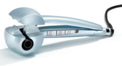
C1700E 20 € CASHBACK*